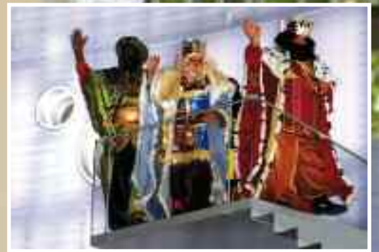
Fiesta de Reyes: 4 enero 2012 Página 33