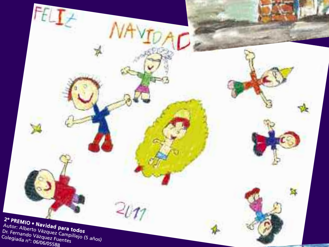
2º PREMIO • Navidad para todos Autor: Alberto Vázquez Campillejo (5 años) Dr. Fernando Vázquez Fuentes Colegiada n o : 06/06/05588