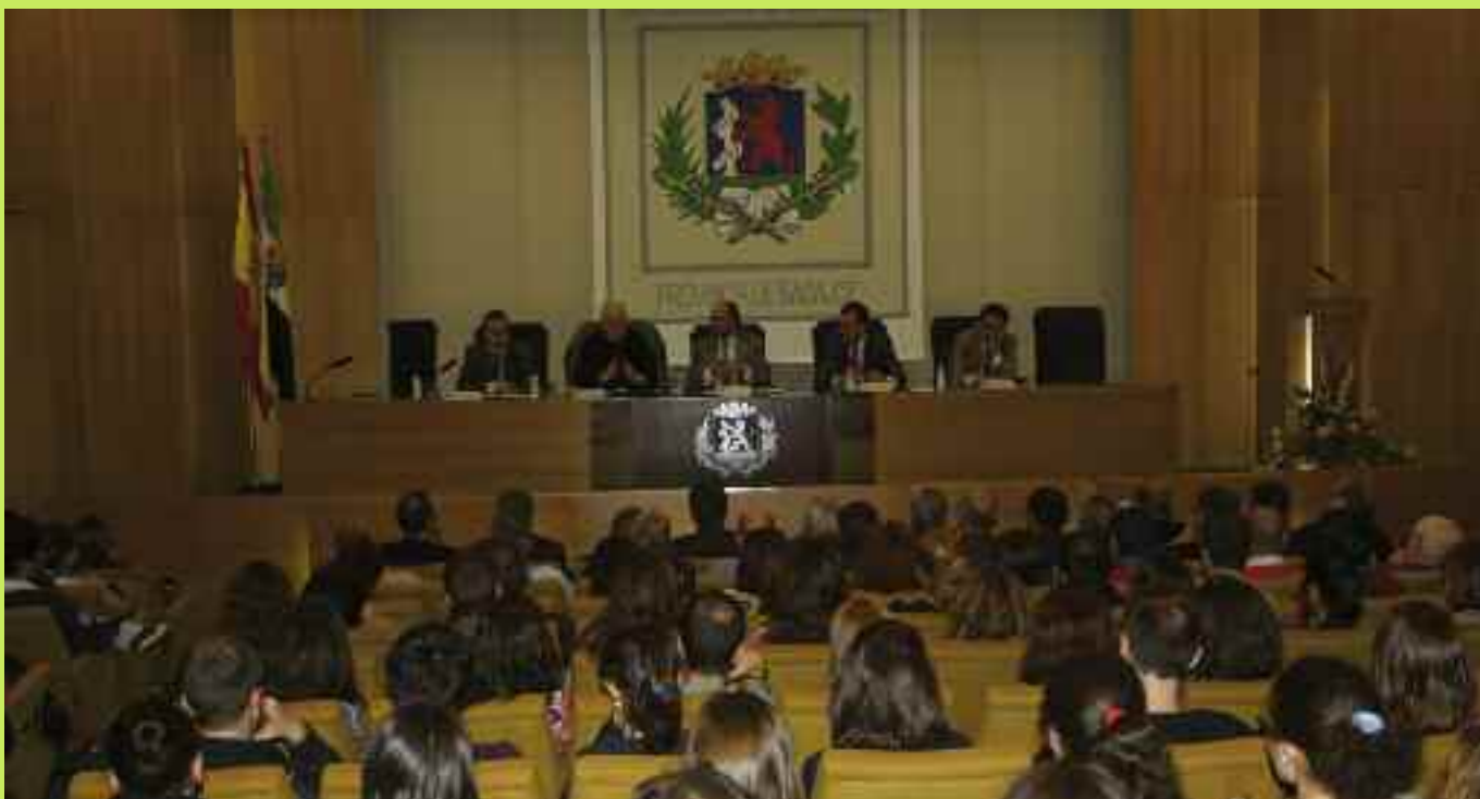
El salón de actos del Colegio se llenó ante el interés del seminario.

eutanásico. Nos vino también a decir, que la Deontología, es en realidad la aplicación de los grandes principios éticos universales a una determinada profesión.