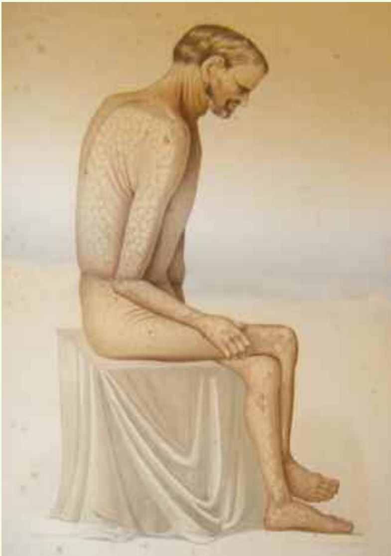
Lámina litografiada doble, representando un paciente de cuerpo entero. "Psoriasis herpético subagudo y generalizado desde su origen".