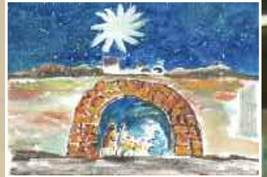
Concurso Tarjetas de Navidad 2011 Página 32