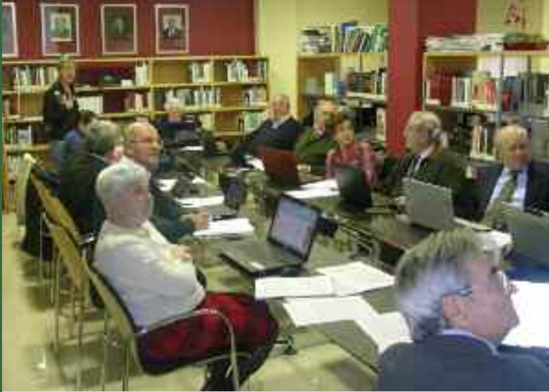
Imagen tomada durante una de las clases en nuestro salón de plenos.

DESDE PRIMEROS DE OCTUBRE Y HASTA FINALES DE DICIEMBRE