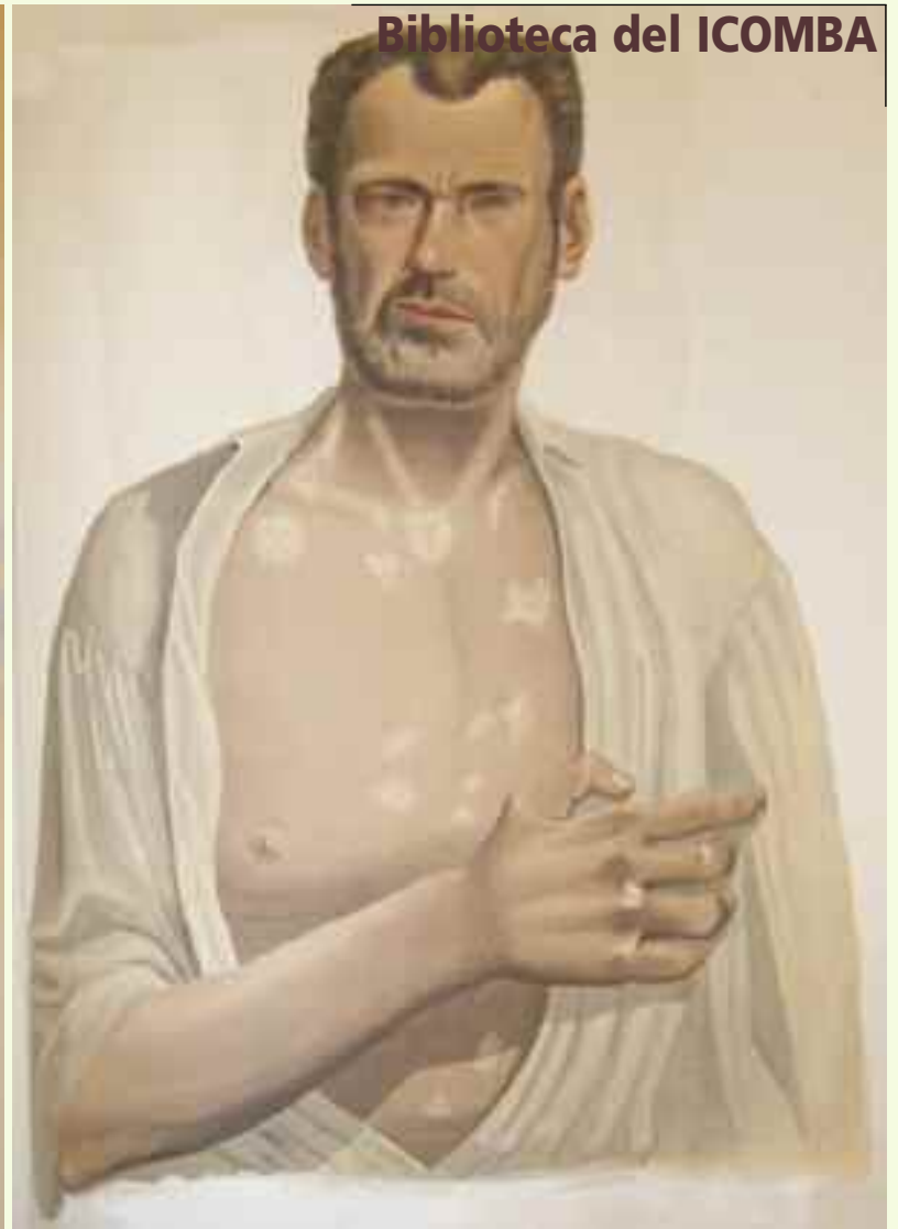
Lámina ilustrada por D. José Acevedo. "Lepra Anestésica (Tercer Periodo)".

El más encumbrado de los dos es el segundo volumen "Atlas de la clínica iconográfica de enfermedades de la piel o dermatosis" que cuenta con un total de 165 láminas litografiadas en color (6 de ellas dobles, representando a pacientes de cuerpo entero), cuya tirada (si deducimos del sello que contiene cada una con una numeración de 4 cifras) podría ser de 1000 ejemplares. Ilustradas por José Acevedo a pie de enfermo, en ellas se refleja la corriente pictórica realista de la época. En nuestra biblioteca se conservan 42 de ellas, una de las cuales es doble.