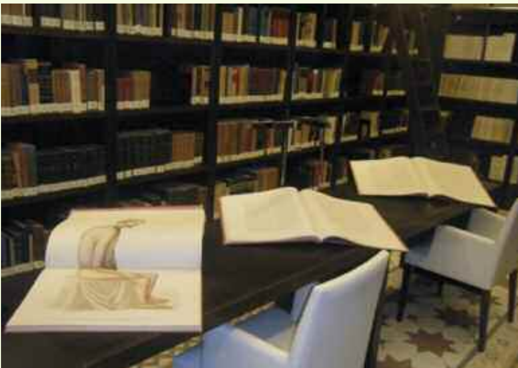
"Dermatología general y Atlas de la clínica iconográfica de enfermedades de la piel o dermatosis" por Dr. D. José Eugenio Olavide.

En la biblioteca de libros antiguos del Colegio podemos encontrar estas dos últimas partes, tanto las "Lecciones teórico-clínicas sobre las dermatosis pseudo-exantemáticas ó congestiones e inflamaciones cutáneas agudas idiopáticas y estudio comparativo de sus lesiones con las demás lesiones cutáneas de forma elemental análoga" datada en 1874; como las "Lecciones teórico-clínicas sobre las dermatosis constitucionales", fechada en 1880, en las que Olavide advierte tras el título "tomadas taquigráficamente por dos socios del Instituto Taquigráfico Español" advirtiendo que "por sus muchas ocupaciones, quedan tal como se han pronunciado y sin la corrección necesaria", prueba de la premura que tenía en verlo publicado.