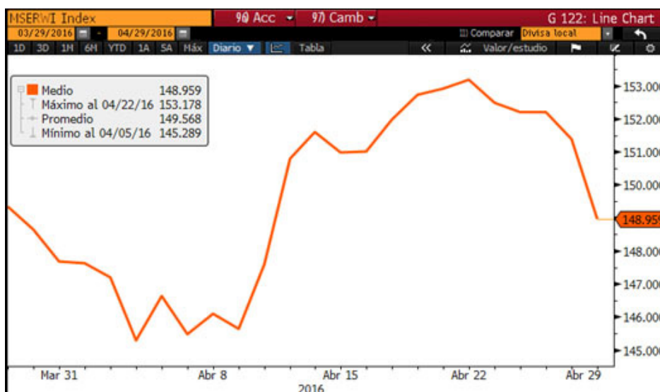
Figura 2: Gráfico con la evolución mundial de las bolsas recogido a través del índice MSCI World Index

Las bolsas estadounidenses han cerrado el mes en positivo con un incremento del 0,27% en el caso del S&P500, ya que la presentación de resultados ha sido mejor de lo esperado para esta temporada superando el consenso, que recogía expectativas muy negativas.