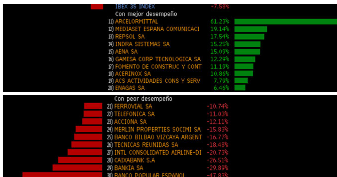
Figura 3: Gráfico Mejor/Peor comportamiento Ibox 35 desde inicio de 2016.