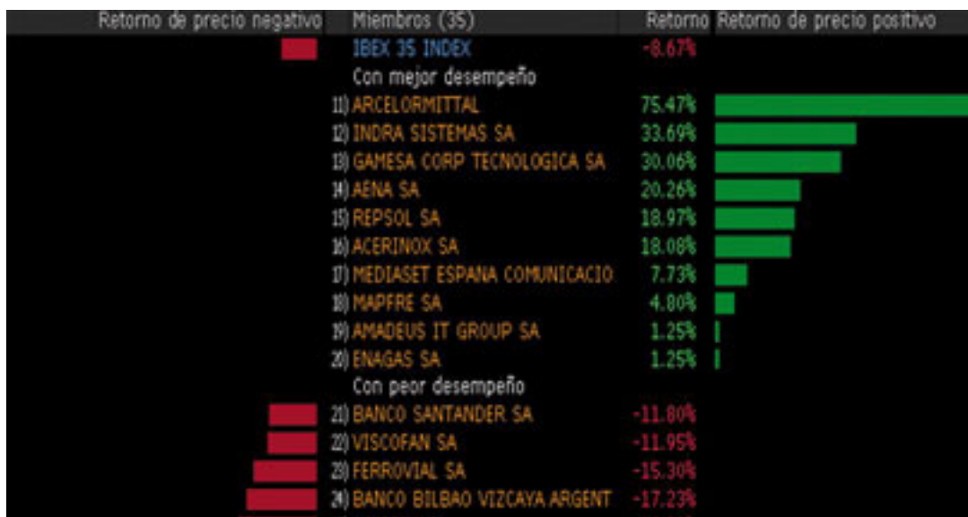
Figura 3: Gráfico Mejor/Peor comportamiento Ibex 35 desde inicio de 2016.

El mercado de divisas ha seguido estable y sin cambios. El euro-dólar cerró en niveles del 1.15 EUR/USD. La libra sigue cotizando en el mismo nivel del mes anterior de 0.845 EUR/GBP. Sin embargo, el Yen japonés se depreció un -1% y vuelve a niveles de 115 EUR/JPY.