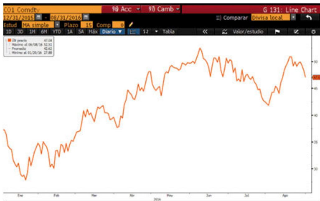
Figura 2: Gráfico de la variación del precio del barril Brent en el 2016.

El IBEX cerraba agosto con una revalorización del 2.39%, y el índice europeo Eurostoxx50 anotó una subida por encima del 1%. El DAX lideraba las subidas con una revalorización del 2.5%. El resto de plazas europeas seguían la tendencia con un comportamiento positivo, el CAC40 subía ligeramente hasta un 0.66% y en Italia, a pesar del ruido a causa de la banca, el FTSE MIB subió un 2.3%. En Estados Unidos, el selectivo S&P500 se mantenía estable y se dejaba en el mes un -0.12%. Las bolsas emergentes, a pesar de la amenaza de subida de tipos, también tenían un buen comportamiento con una subida del MSCI emergentes por encima el 2%.