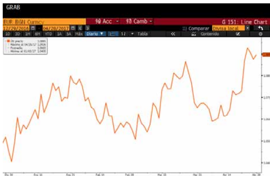
Figura 2: Gráfico que recoge la evolución del euro dólar desde inicio de 2017.

Este contexto está siendo muy positivo para los índices bursátiles ya que prácticamente todas las bolsas se han anotado ganancias en el mes. En Europa la publicación de resultados no está tan avanzada aún pero los índices han seguido descontando crecimiento. Así el índice Eurostoxx 50 se revalorizaba un 1.68%, el CAC se anotó un 2.83% lo que reflejó la menor incertidumbre tras el resultado electoral. En España a medida que los datos siguen mostrando dinamismo los mercados parecen seguir apostando por el IBEX35 que subió un 2.42%. Algo más parco fue el comportamiento del Dax que tan solo se revalorizó un 1% aunque volvió a pulverizar sus máximos. El S&P500 mostró un comportamiento más moderado debido en parte a la incertidumbre sobre la capacidad de Trump de cumplir algunas de las promesas de campaña electoral.