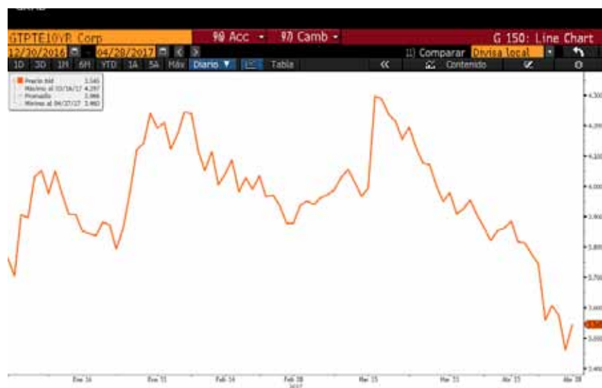
Figura 1: Gráfico que recoge la rentabilidad exigida a la deuda soberana de Portugal.

Los mercados de renta fija han tenido un comportamiento positivo durante el mes de abril, principalmente apoyado por los discursos continuistas de los bancos centrales. La deuda periférica y los bonos de empresas se vieron beneficiados del tirón de los bonos de mayor calidad y los datos de resultados de las empresas. En el caso del bono español la rentabilidad exigida a 10 años se redujo en 2 p.b al pasar de 1.66% a 1.64% al cierre de abril. En el resto de periféricos el comportamiento también fue positivo con estrechamientos tanto en las curvas italianas como en los bonos de Portugal, que pasaron de reducir su rentabilidad exigida 2 p.b y 43 p.b respectivamente.