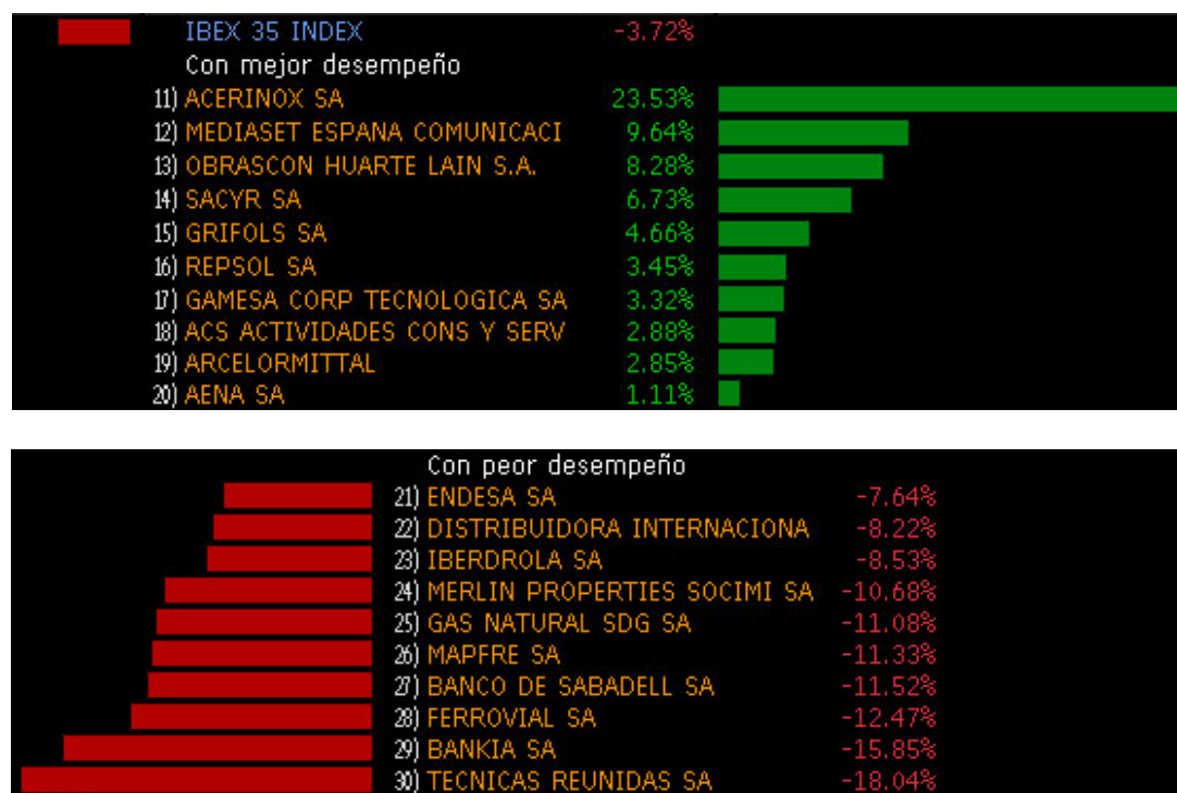
Figura 3: Gráfico Mejor/Peor comportamiento Eurostoxx 50 del Mes.

Otro de los hitos del mes ha sido el acuerdo de los principales países exportadores de petróleo, Rusia y Arabia Saudita, que acordaron congelar la producción para hacer frente a un exceso de suministros. El acuerdo estaría sujeto a que otros países productores se sumen a la disminución de su producción. En un primer momento, y tras conocerse el acuerdo el precio del barril subió hasta los 35.50 dólares, pero finalmente retrocedía ante la preocupación de una negativa por parte de Irán.