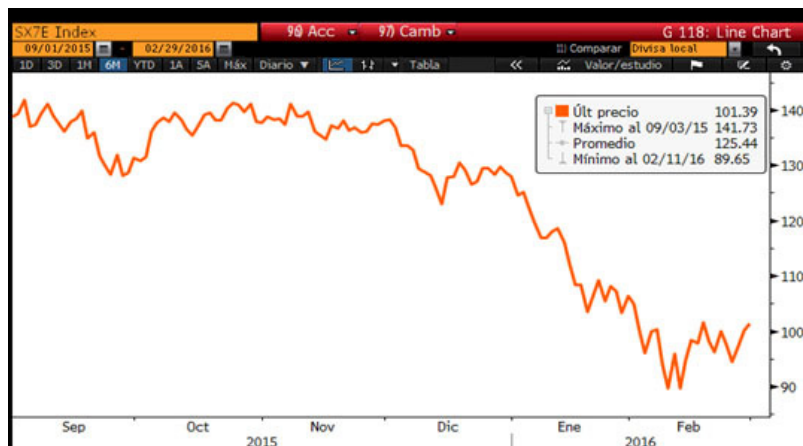
Figura 2: Gráfico Eutostox Bank Index que recoge el comportamiento del sector financiero europeo

Los índices americanos tuvieron un comportamiento ligeramente mejor que las bolsas europeas. El S&P500 retrocedía un 0.37% y el índice tecnológico Nasdaq perdía en el mes 1.35%.