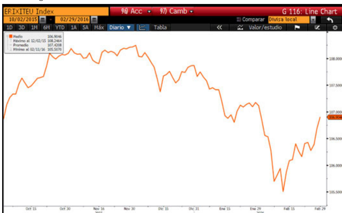
Figura 1: Gráfico Itraxx Main donde se puede observar la fuerte caída de los bonos Corporates

En el mercado de crédito hemos visto un fuerte movimiento de ampliación de los spread. Varios factores técnicos han motivado este movimiento de caída de precios, como la falta de liquidez o la correlación con la renta variable. Además el aumento del riesgo de algunos emisores ligados al sector de energía en EEUU ha contagiado en parte al resto de corporates, especialmente en el mercado High Yield.