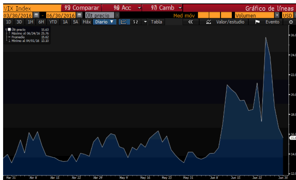
“Gráfico del Vix, índice que mide la volatilidad en el mercado donde podemos observar el fuerte repunte a consecuencia del Brexit”

El primer semestre de 2016 se ha caracterizado por un importante repunte de la volatilidad. A principios de año los mercados arrancaban con las preocupaciones por el crecimiento en China ocasionando un fuerte impacto en las materias primas y en los precios del petróleo. A partir de Febrero los mercados iniciaron una recuperación paulatina hasta el mes de Mayo, donde pudimos ver cierta estabilidad y la recuperación del precio del petróleo. Las intervenciones de los bancos centrales, y en especial el BCE, han continuado apoyando al mercado con políticas expansivas y finalmente el retraso en la subida de tipos en EEUU ha supuesto un balón de oxígeno para las bolsas y para la deuda de los países emergentes. Esta volatilidad, que se intensificó fuertemente al cierre del trimestre debido al resultado del Brexit, provocó un pánico vendedor en las plazas bursátiles del todo el mundo con un desplome histórico que dejaba a la libra en mínimos de 30 años.