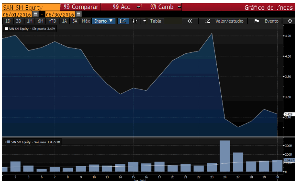
“Gráfico con la evolución en el mes de junio de Banco Santander donde se puede observar el desplome a causa del resultado del Brexit”

Las bolsas mundiales han tenido un comportamiento divergente en las principales zonas geográficas de occidente. La volatilidad ha continuado presente en los mercados tras el complicado inicio de año con las incertidumbres de China y la incertidumbre por el referéndum de UK ha continuado siendo un freno para algunos de los principales índices europeos. Así, el Eurostoxx50 ha finalizado el trimestre con una caída del -4.67%, lo que supone un descenso en el año del -12.67%. El IBEX35 ha tenido el peor comportamiento en Europa con un caída trimestral del -6.47%, lastrado principalmente por el del sector bancario y por alguna de las principales compañías debido a su alta exposición a Reino Unido. Le siguen el CAC40 y el DAX30 que se dejan en el trimestre un -3.37% y un -2.86% respectivamente.