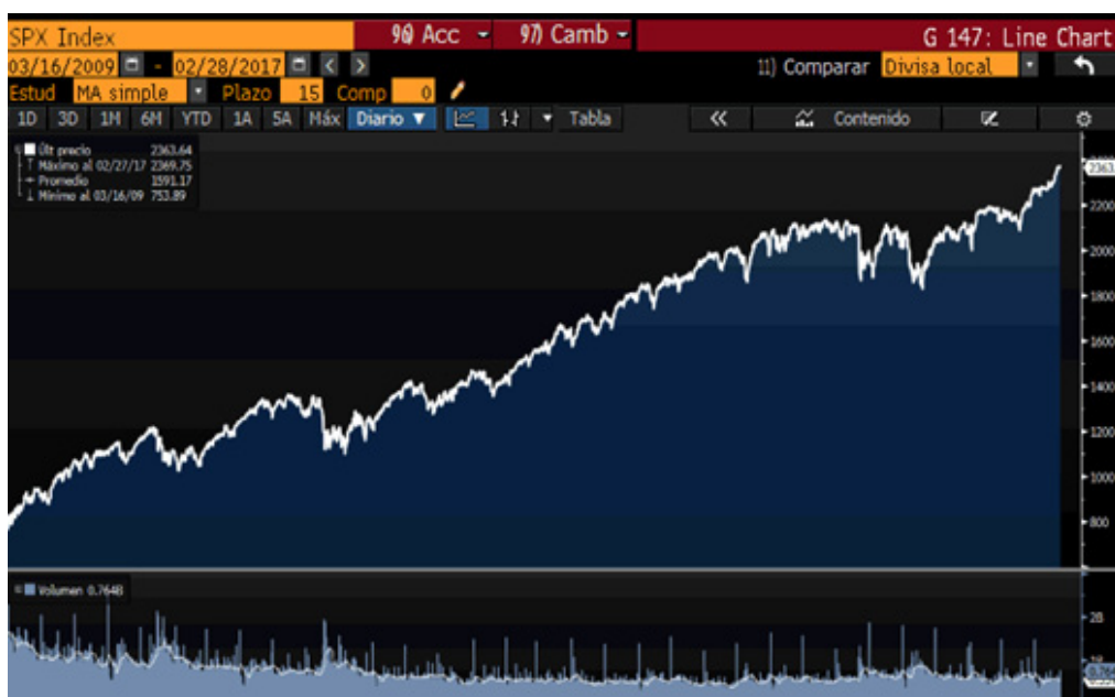
Figura 2: Gráfico que recoge la tendencia alcista del S&P500 ha pasado de 600 puntos a niveles de 2.360 puntos desde 2009.

Los países emergentes en líneas generales han continuado con la tendencia positiva del resto de los índices si nos remitimos al índice MSCI emergentes, que se anotó un 3% en el mes de febrero, aunque con resultados dispares de las diferentes regiones.